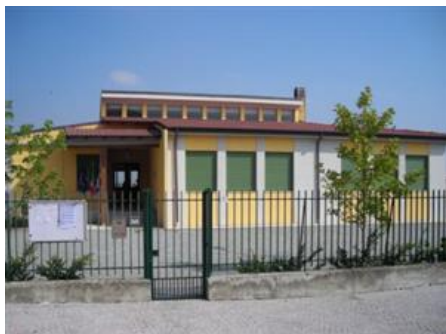
ia di Asigliano