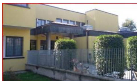
I Grado di Villata