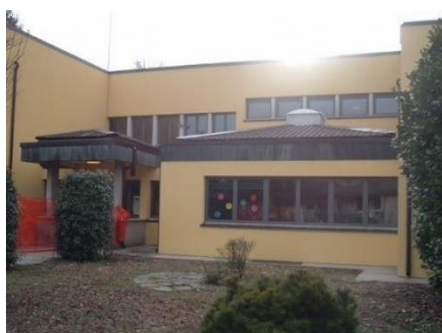
Primaria di Ronsecco